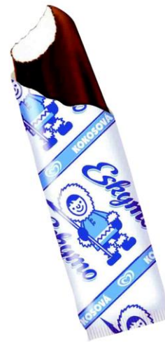
Nanuk Eskymo Algida Praha