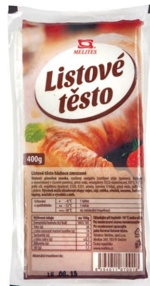
Listové těsto Melites Uničov