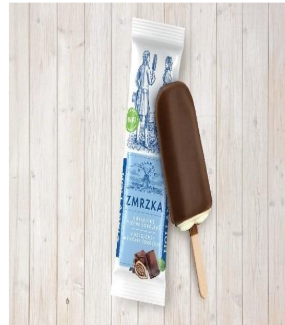
Nanuk Hollandia Karlovy Vary