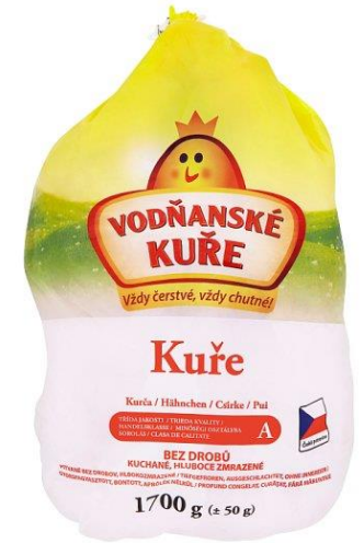
kuře Vodňanské kuře Vodňany