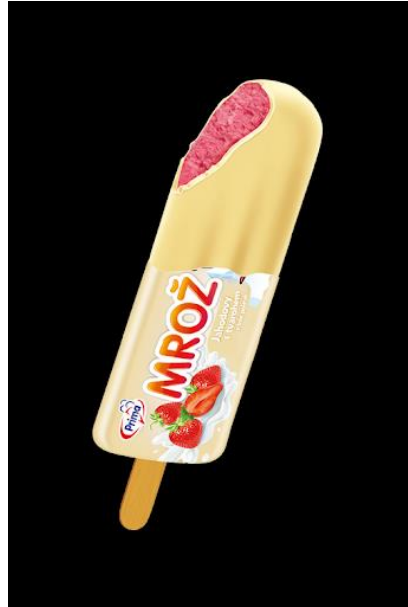
Nanuk Mrož Prima Opava