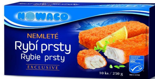
Rybí prsty Nowaco Kralupy nad Vltavou