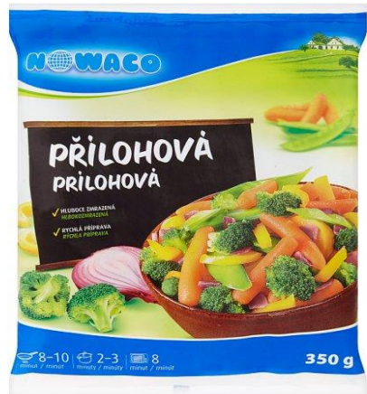
Přílohová zelenina Nowaco Kralupy nad Vltavou