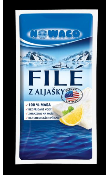
Filé Nowaco Kralupy nad Vltavou