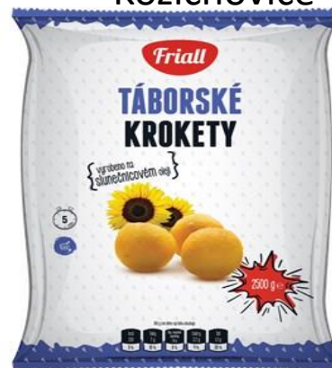
Krokety Friall Tábor