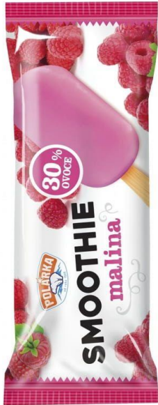
Nanuk Smoothie Polárka Praha