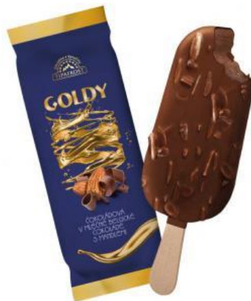
Nanuk Tipafrost Kožichovice