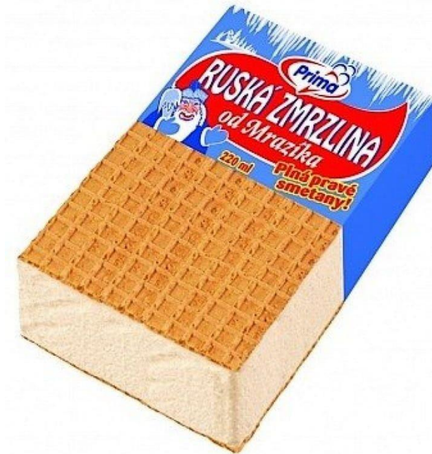
Ruská zmrzlina Prima Opava