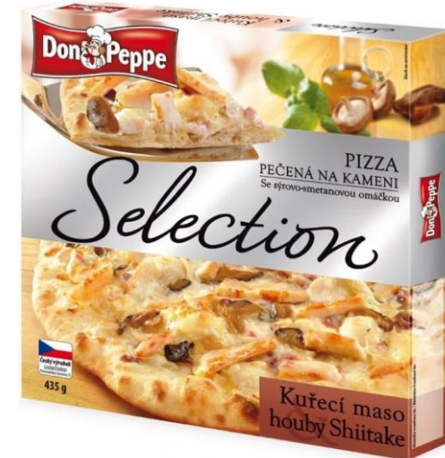
Pizza Don Pepe Otrokovice