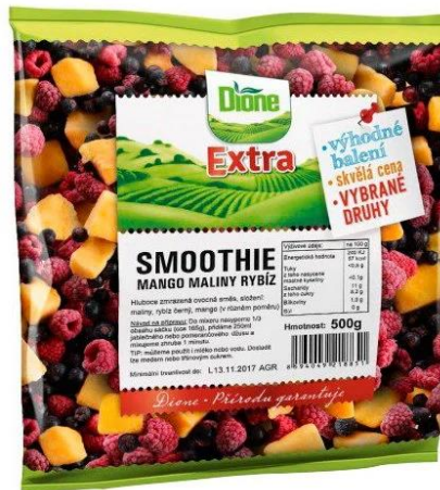
Mražené ovoce Dione Panenské Břežany