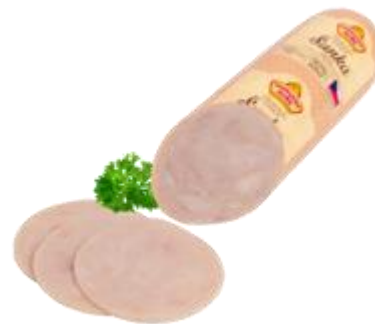
Výběrová (90% masa)