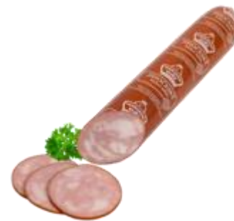
Jihočeský kuřecí salám